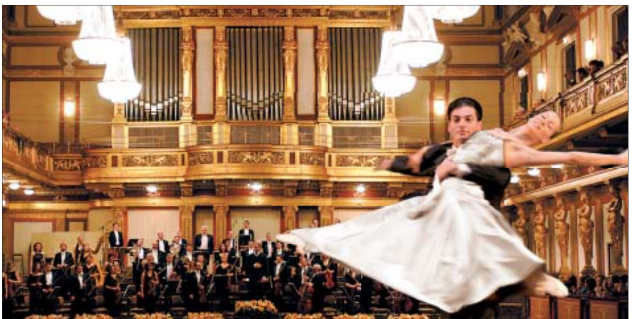
"Wiener Johann Strauss koncert-galla" – kan opleves søndag, den 8. februar i Musikhuset

Fire par fra "Das Österreichische K&K Ballett"