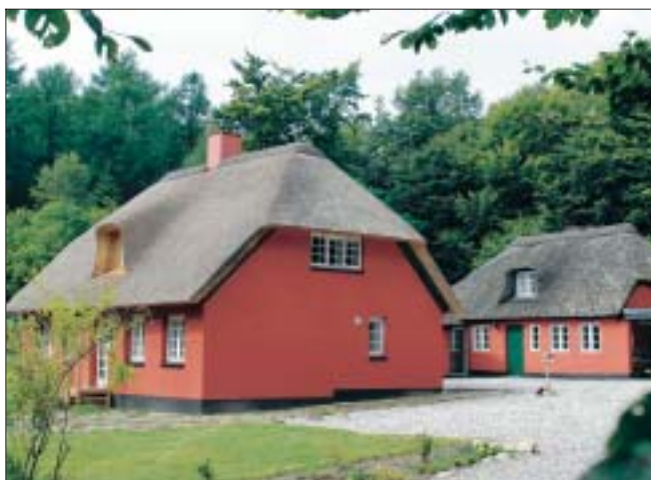
I Katholm skov ligger tidligere skovfoged- og skovløberhuse, som udlejes af Katholm Gods. Et af de charmerende skovløberhuse har netop fået nyt stråtag.