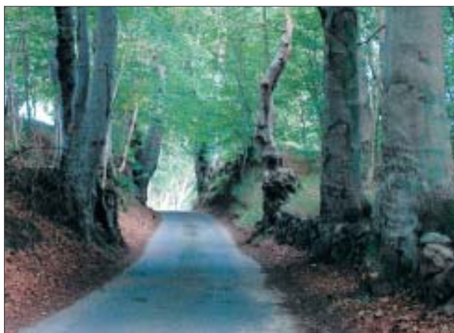
Få hundrede meter, før man kommer til Katholm Gods fører vejen igennem en tæt skovbevoksning.

Læs mere om Katholm Gods på www.katholm-gods.dk