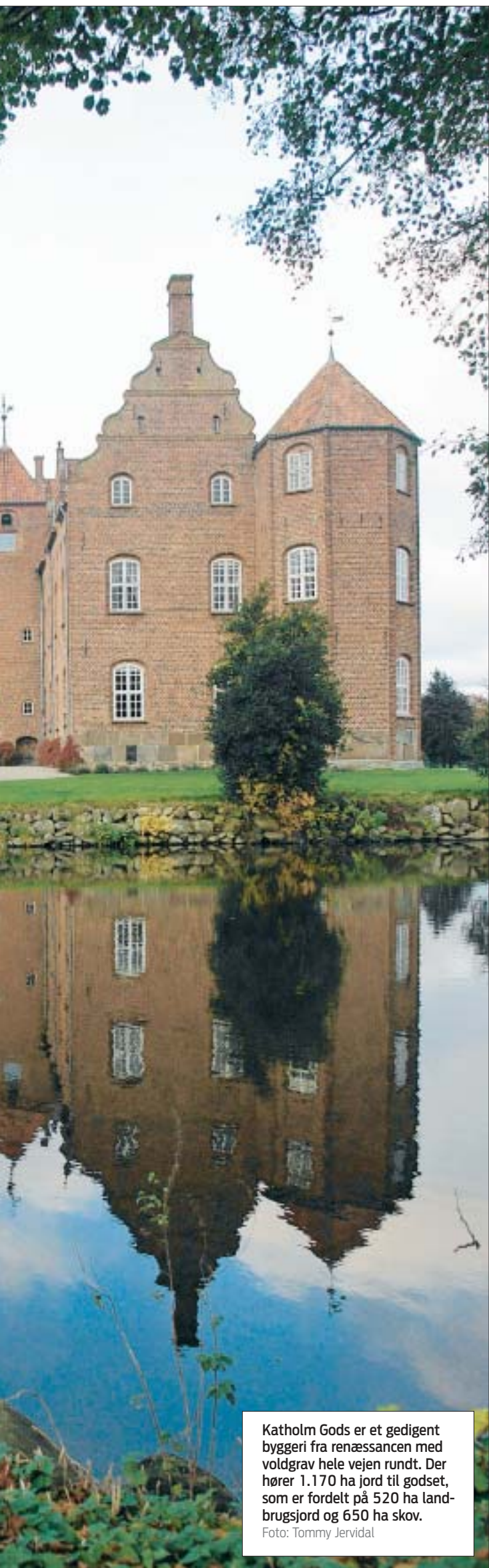
Katholm Gods er et gedigent byggeri fra renessancen med voldgrav hele vejen rundt. Der hører 1.170 ha jord til godset, som er fordelt på 520 ha landbrugsjord og 650 ha skov.

Katholm Gods på Djursland er en af Danmarks ældste og smukkeste renaissancebygninger. I over 400 år har Katholm ligget syd for Grenaa, omgivet af betagende skov og lige ud til en af Danmarks bedste badestrande, Fuglsang Strand.