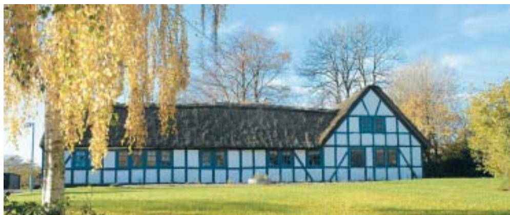
1750-GÅRD | Skødstrup ligger denne firelængede gård fra 1750, som Multiman Ejendomme til sommer går i gang med at gennemrenovere til fire ejerlejligheder.